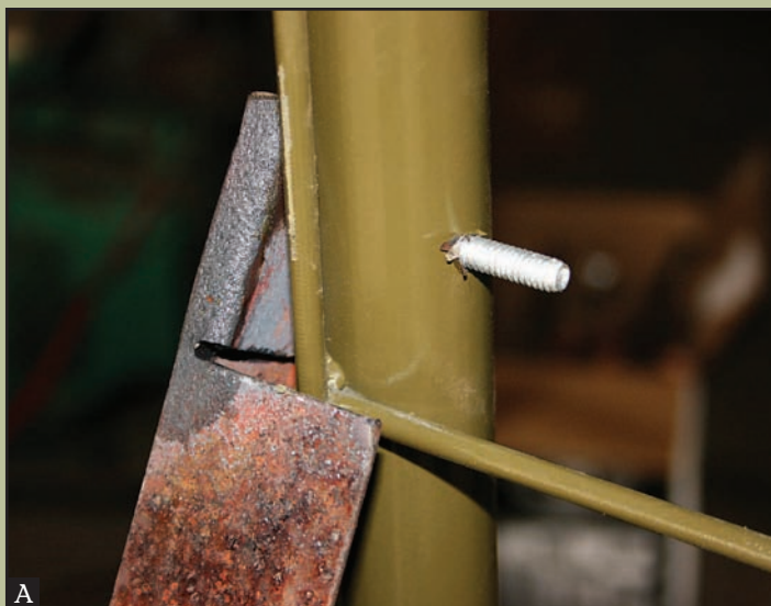
Un perno fija el soporte al marco de la puerta (A). Una vez acoplado, la cuerda o cadena sostiene el soporte (B).